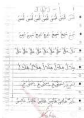
الصورة ٢: تقديم الوظيفة للتصحيح

وبعد توجيه المادة أمر المدرس الطلبة بكتابة وإكمال الوظيفة التي اشتملت في الكتب المطبوعة ومتزوعة في أول لقاء بطريق تقليده. وسارت عملية تعليم الخط بطريقتين أثناء التعليم منهما طريقة أمشاق المفردات وطريقة أمشاق التركيبات. كما وفقت طريقة تعليم الخط على أساليب الطريقتين المعينتين السابقة (Sirin, 1993) بداية بتعليم الحروف الهجائية ثم بتعليم تركيبات الجمل، مما يتم البدء في مشك الكتابة أولاً بالمفردات. بعد أن كتبوا الطلبة الوظيفة قدموها إلى المدرس واحدا فواحدا للتصويب والتصحيح مباشرة. وبخلاف ذلك فإن المدرس في هذه الفرصة يقبل الوظيفة أثناء التعليم كما لجأ المعلم لإصلاح أخطاء الطلبة لم يكن تفصيلا كتيبان اصول الحروف أو الحروف الخاطيئات غير إصلاح لها، بل أتى النتيجة للكاتب عاجلا حتى تجعل الكتابة لم تناسب بأهداف تعليم تحسين الخط بما أن هدفه لا تؤكد على شكل الحروف في تشكيل الجمل فقط، لكنها تلمس الجوانب الجمالية (Ni'mah, 2019). كما اتضح التصحيح في الصورة الآتية: