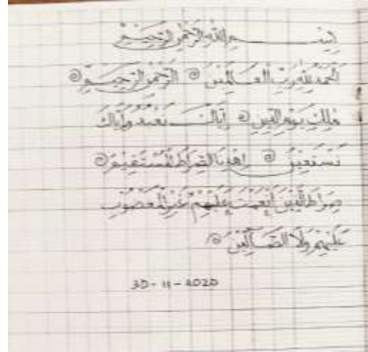
الصورة ٣: جودة الكتابة قبل التعلم

ورابعاً أن حلول المشكلة الرابعة من المستحسن أن يدافع المعلم الطلبة بأن يعبر أهمية تعليم الخط العربي لحياة القادمة. مما أكد أن الدوافع عبارة عن محاولة أساسية التي يحرك الفرد للقيام بعمل ما عين (B,Uno, 2016).